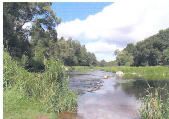
Prie Ventos regioninio parko gamtos išsaugojimo gali prisidėti kiekvienas gyventojas

Apklauso rezultatai parodė, kad gyventojai aktyviai leidžia laisvalaikį prie vandens telkinių: zve-