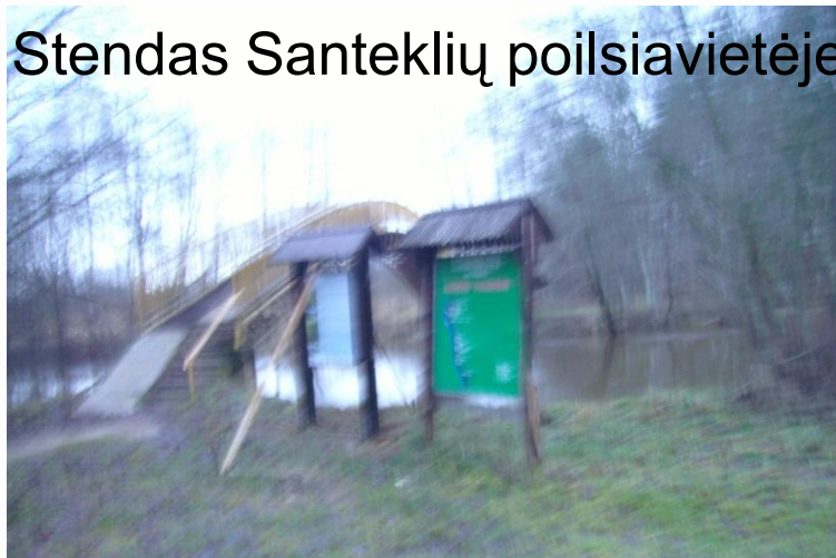
Stendas Santeklių poilsiavietėje