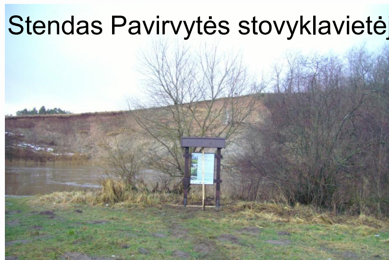
Stendas Pavirvytės stovyklavietėje